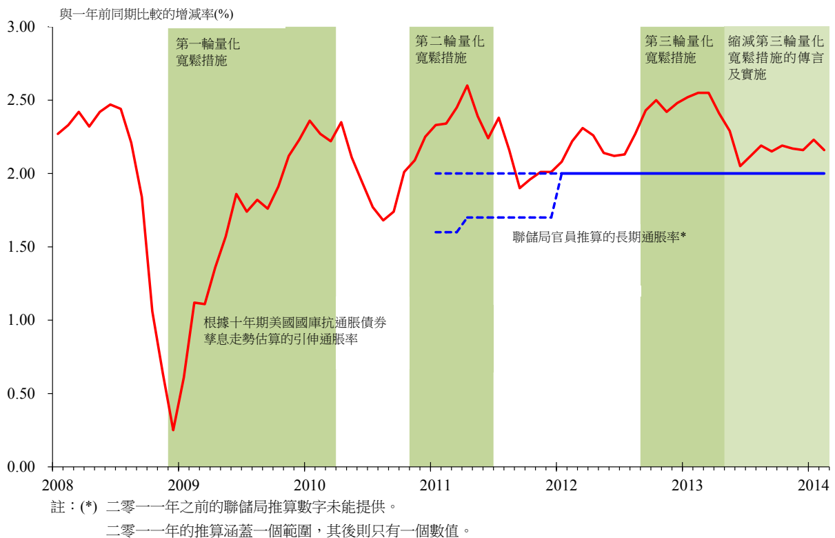
圖 2：長期通脹率預期

總括來說，引伸通脹率自二零一三年年中起在 2.2%左右徘徊，長期通脹預期仍在聯儲局的目標水平附近企穩，支持聯儲局繼續減買資產。不過，如果實際通脹率日後仍處於低水平，甚至拖低預期的長期通脹，聯儲局便可能有需要減慢撤回貨幣刺激措施的步伐，甚或重推措施，以履行穩定物價的要務。美國的通脹走勢影響深遠，亟須密切注視。